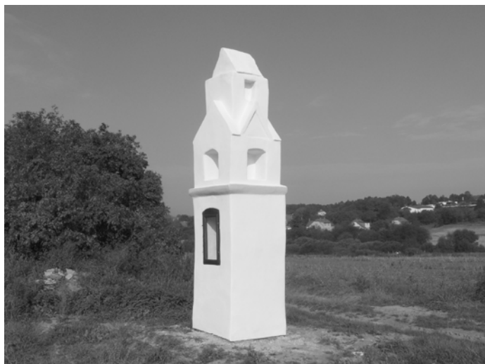
Kaple sv. Jana Křtitele