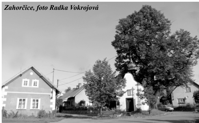
Zahorčice, foto Radka Vokrojová