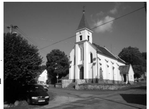
Kostel Sv. Ludmily v Zadních Zborovicích.