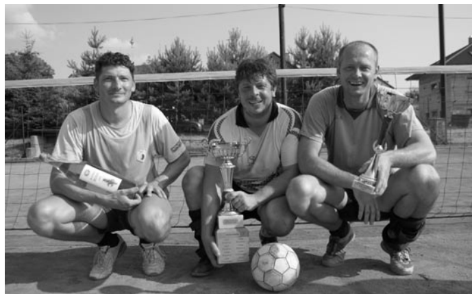
Zabijáci - vítěz nohejbalového turnaje