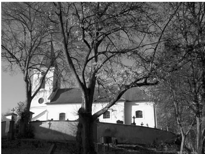
Kostel Nejsvětější Trojice v Černívsku.

Obec je v ideální poloze od všech větších sídel v okolí, Blatná 13 km, Březnice 10, Mirovice 10, Bělčice 10, Strakonice 34, Písek 35, Příbram 26, Rožmitál pod Třemšínem 18 km. Nadmořská výška je přibližně 500 metrů nad mořem. V zimním období jsme dostatečně zásobeni sněhem, ačkoliv v sousedních obcích tomu tak není - přičítáme tuto skutečnost sousední Drahenické hoře, která je asi 600 m.n.m. Celková výměra katastru je 662 ha, z toho 356 ha zemědělská půda, 250 ha lesních porostů a asi 28 ha vodních ploch, zbytek je ostatní.