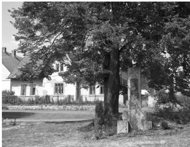
Obec Uzenice

Z čeho máte ve svém úřadu radost? Z každé práce, kterou se zdárně podaří realizovat.