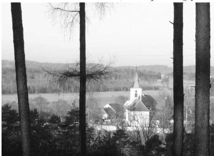
Kostel Nejsvětější Trojice v Černívsku