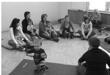
Sedíme a básničkujeme.

Mateřské centrum Kapřík zahájí svůj pravidelný provoz po prázdninách v pondělí 13. září. Na začátku září budou totiž prostory centra sloužit ještě kurzu pro maminky a tatínky na mateřské či rodičovské dovolené nebo pro maminky a tatínky, kteří jsou v evidenci úřadu práce. Tento kurz probíhá za finanční pomoci Evropského sociálního fondu již od začátku července a obsahuje např. moduly Informační technologie, Základy podnikání, Kurz osobního rozvoje apod. V době konání kurzu mateřské centrum zajišťuje hlídání dětí pro maminky na kurzu, a tak bude centrum pro veřejnost otevřeno pouze ve středu dopoledne.