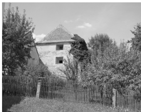
Tvrz v Uzeničkách, kulturní památka.

Obec Uzeničky leží 9 km severovýchodně od Blatné. Ves Uzeničky se poprvé připomíná v letech 1364-1399 jako majetek pánů z Křikavy (1364 Konrád, 1394 Henzelín, 1399 Jindřich z Dornštejna). Dalším známým majitelem Uzeniček byl Racek z Dlouhé Vsi. Okolo roku 1517