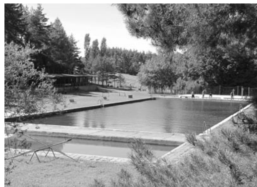
Koupaliště v Radomyšli, foto Ing. Vladimír Kocourek

Všichni jistě víte, že v Radomyšli je letní areál, přírodní koupaliště s ubytováním a příjemným, udržovaným prostředím. Díky panu Vackovi je tady strávený čas pěkný.