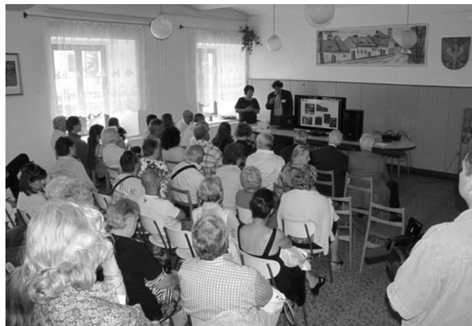
Mezinárodní seminář na radnici

Twinning mezi Radomyšlí a Montoggio byl odstartován v roce 2006. Podobná partnerství mají velký význam pro to, aby se lidé různých kultur lépe poznali, což je velmi důležité pro budoucnost jednotné Evropy. Velmi přínosná je rovněž výměna zkušeností z různých oblastí života a fungování obcí a také z oblastí realizace projektů.