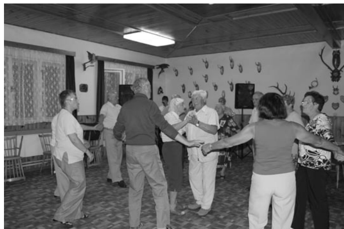
Sólo pro nejstarší účastníci z Kadova

V sobotu 12. června opět proběhlo „Setkání důchodců“ na myslivecké chatě v Kadově s hudbou, předtančením i občerstvením. Všem, kteří se zúčastnili se akce líbila, svoz seniorů byl zajištěn.