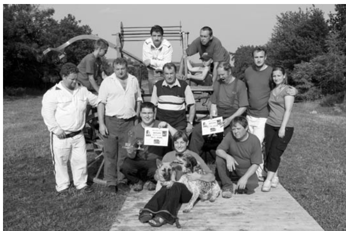
Členky a členové SDH Hornosín po vyhlášení výsledků