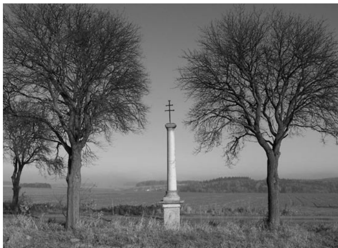
Barokní kříž u cesty do Myštic.