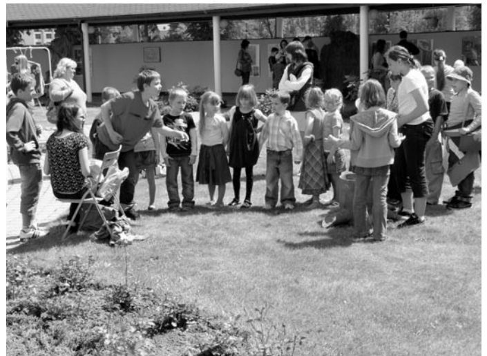
Při slavnostním vyhodnocení výsledků soutěže 7. ročníku o přírodě Blatenska, letos na téma „Všechno lítá, co peří má!“ si po celé odpoledne v ambitu domova důchodců mohli zájemci vyzkoušet své dovednosti a trpělivost.