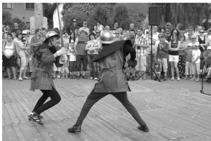
Součástí programu byly rytířské souboje