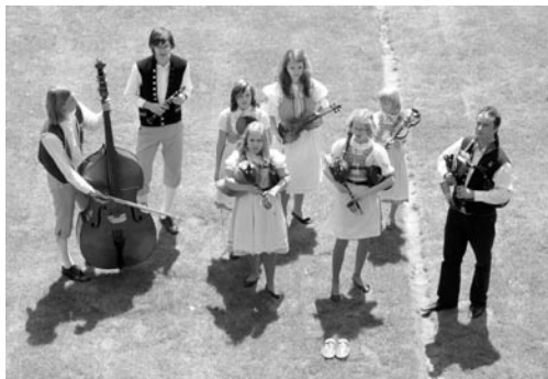
Při slavnostním vyhodnocení se o hudební doprovod postarali dudáci ze ZUŠ Blatná.