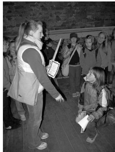
Kluci byli pasováni na rytíře hradu Kašperk.