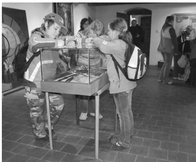
A ještě malá zkouška vědomostí z historie v kouzelných prostorách hradu Kašperk. Všichni by zkoušku zvládli, kdyby se známkovalo.