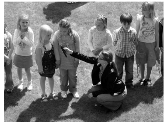
Děti z blatenských mateřských škol si připravily pásmo říkáněk a písniček o ptáčích. Vždyť všechno lítá, co peří má!