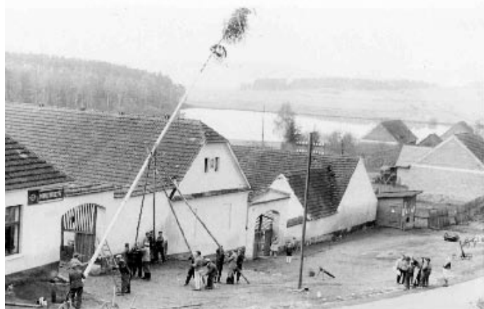
Stavění máje ve Skaličanech v roce 1968, foto Jaroslav Šoun.

Ilustrační foto ke dni dětí Ing. Václav Cheníček