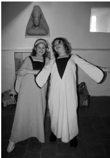
Na hradě Kašperk jsme plnili různé úkoly. Středověký tanec v dobovém kostýmu si vyzkoušela mladší děvčata.