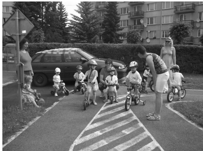
Příprava na závod

v ZUS Blatná v ředitelně školy 1. patro, dveře č. 16 spojeno s prohlídkou školy