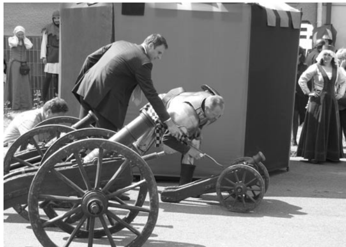
Hejtman zahajuje slavnosti výstřelem z děla