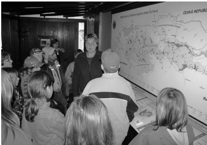
Infocentrum Šumavského národního parku v obci Kvilda.