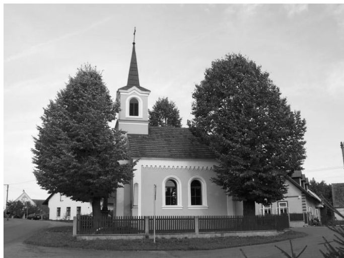
Kaplička v Hajanech