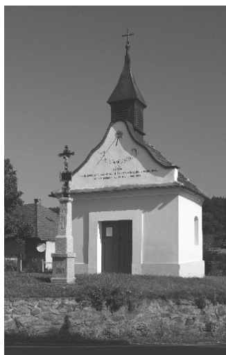
Kaple sv. Jana Nepomuckého v Třebohosticích.