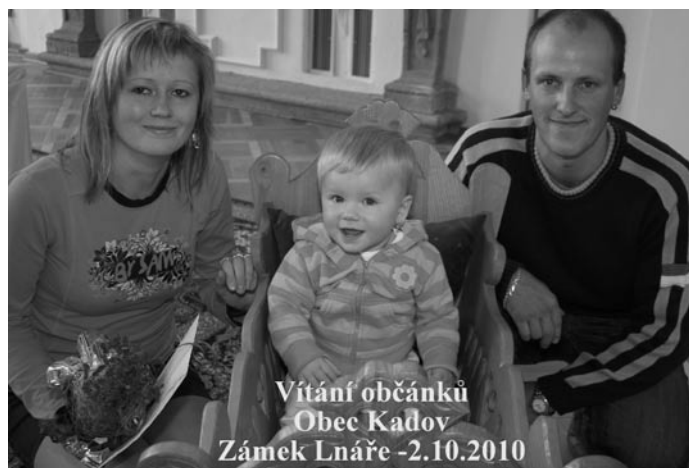
Vítání občánků Obec Kadov Zámek Lnáře - 2.10.2010