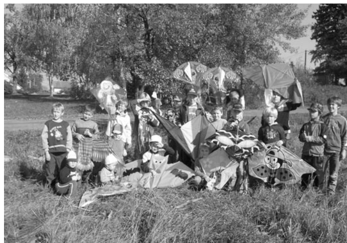
Děti ze ZŠ a MŠ Bělčice