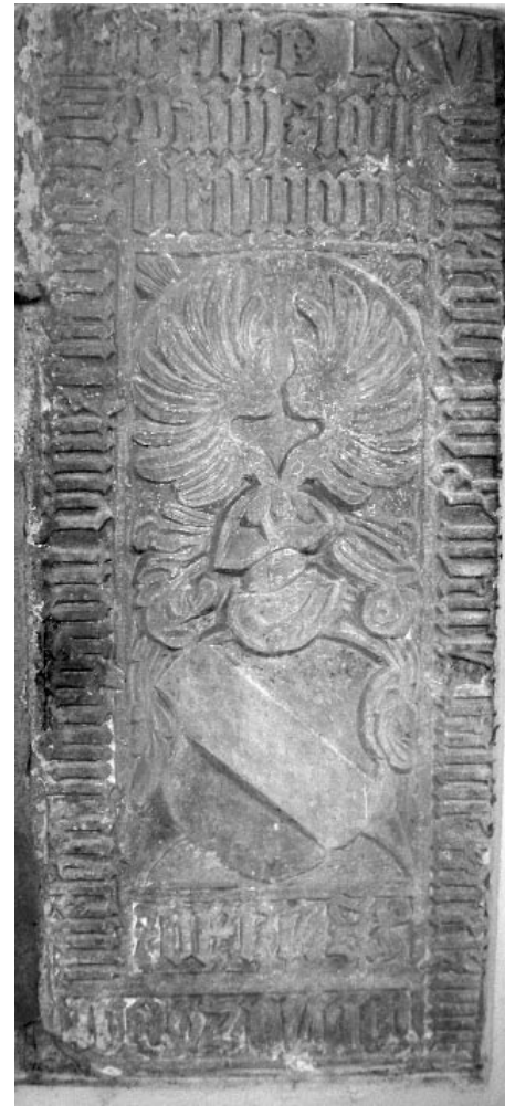
Běšínové - Náhrobek Žofie

Zdeněk Běšín hospodařil na Uzenicích ještě roku 1594 a jak se zdá, byl to on,