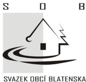
SWAZEK OBCÍ BLATENSKA