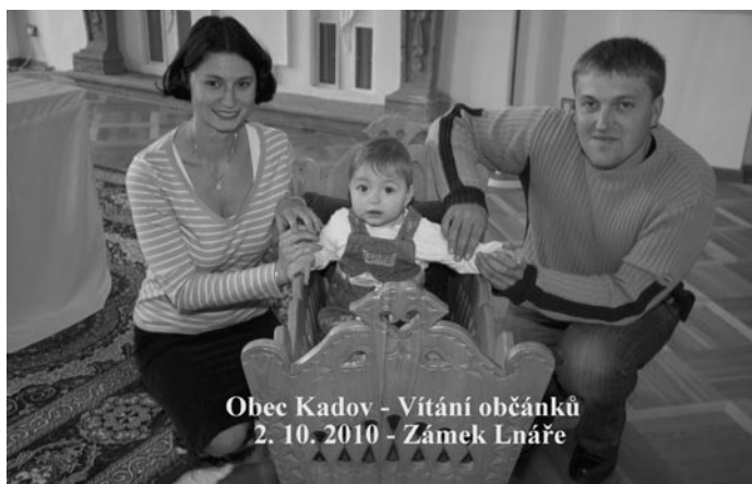
Obec Kadov - Vítání občánků 2. 10. 2010 - Zámek Lnáře