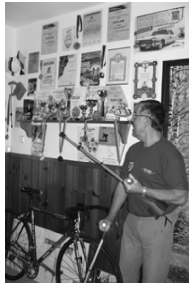
Světská sláva, polní tráva