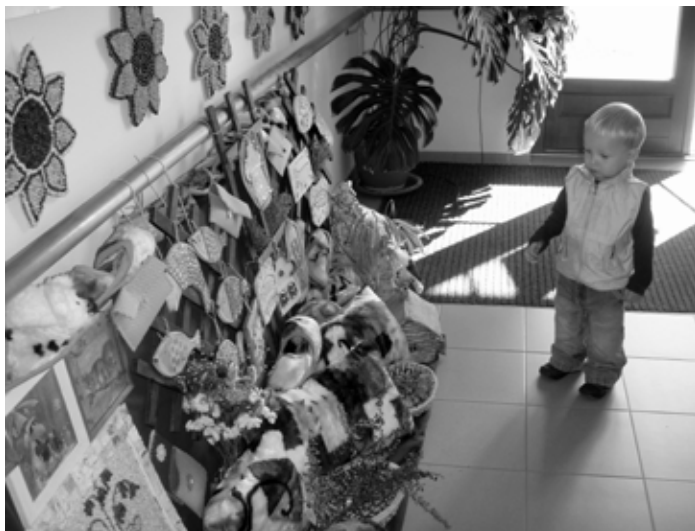
Den otevřených dveří, výstava prací klientů DS Blatná