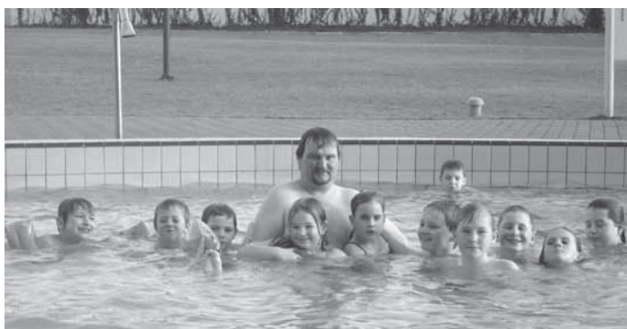
Jarní prázdniny zahájily děti z Tchořovic návštěvou Aquapalace v Praze

5. 3. 2012 navštívili naši malí hasiči AQUA Palace Čestlice v Praze. Akci organizovala obec Hajany a my jsem moc rádi, že i v letošním roce jsme se mohli pěkně vyčvachtat a zrelaxovat.