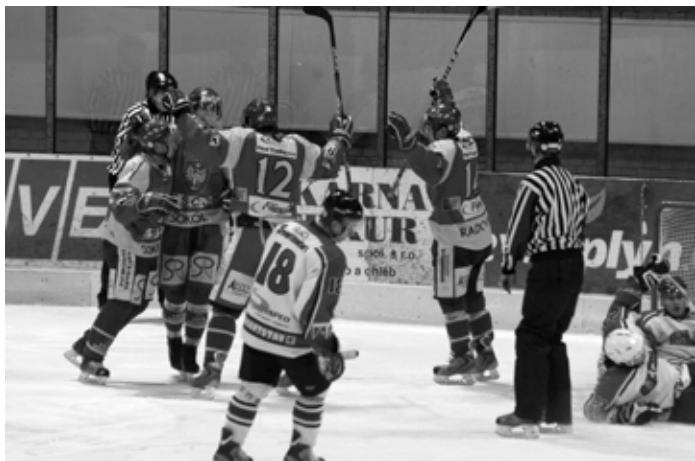
Radost z gólu do sítě okresního rivala ze Strakonice