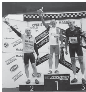
Silniční maratón s mezinárodní účastí, druhý reprezentant z Polska, třetí místo Slovák

„To vyplynulo samo. Nejdřív jsem jen tak mezi známými řekl o naší cestě, následovala pozvání na besedy. Pak mi jeden z posluchačů řekl, že je škoda, že to není i napsané. Napsané jsem to měl, vždyť se musím na cestu připravit (kam pojedu, kolik km denně, kde budeme spát, co chci na cestě navštívit a vidět). Na cestě si vedu cestovní deník (jak jsme splnili plán cesty a zda byl itinerář cesty správný). Na besedy se taky musím připravovat. Takže napsané jsem to měl, fotografií také mnoho. Pak už 'jen' vydat knihu. Měl jsem splněný sen – projet Svatojakubskou cestu, vidět Francii, Španělsko a Portugalsko. Příprava na cestu