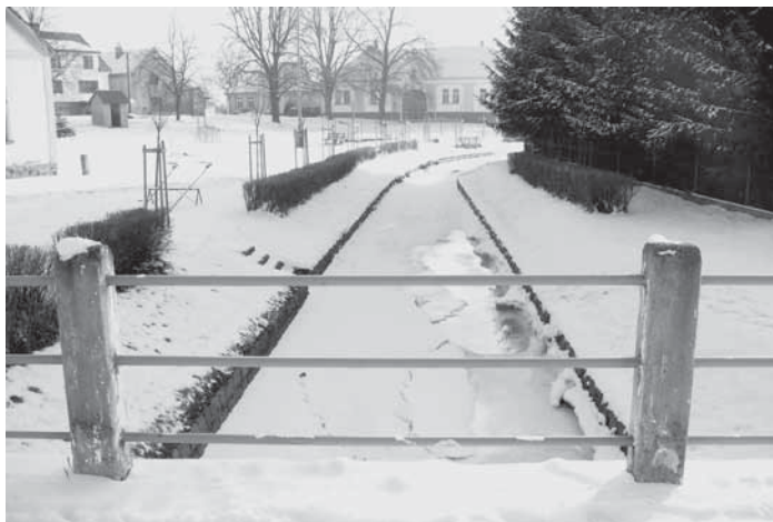
Zamrzlý Rojický potok v obci

Letos nám zima do obce mnoho sněhu nepřinesla. Za to se předvedla v únorových silných mrazech. Ne, že by mrazy nebyly rekordní, ale počasí díky své proměnlivosti nadělalo spoustu starostí, jak zemědělcům na polích, tak správcům a provozovatelům veřejných vodovodů. Po teplém lednu přišel ze dne na den silný mráz a to v noci kolem -20°C a přes den se držela teplota okolo -10°C. Toto mrazivé počasí trvalo zhruba 14 dní a vrcholem byla noc ze soboty 11. února na neděli 12. února, kdy v ranních hodinách dosahovala teplota u Rojického potoka ve Velké Turné bezmála -27°C. Pamatují si mráz v obci i více než -30°C. Jenomže v té době byla sněhová pokrývka do 1 metru. V takovém případě silný mráz neškodí plodinám na polích ani vodovodním rozvodům uloženým v zemi. I nástup mrazů býval pozvolný a následné oteplování nebylo tak náhlé, jak tomu bylo letos. Silné mrazy rychle udeřily a následné prudké oteplení začalo hýbat se zmrazlou půdou, čímž docházelo k pohybu podloží a následkem byly časté poruchy vodovodních řadů. I v obci Velká Turná došlo vlivem rychlých teplotních změn k poškození vodovodního řadu v ulici Na Vinici. Doufejme, že všechny poruchy jsou již opraveny a čeká nás rozkvetlé jaro.