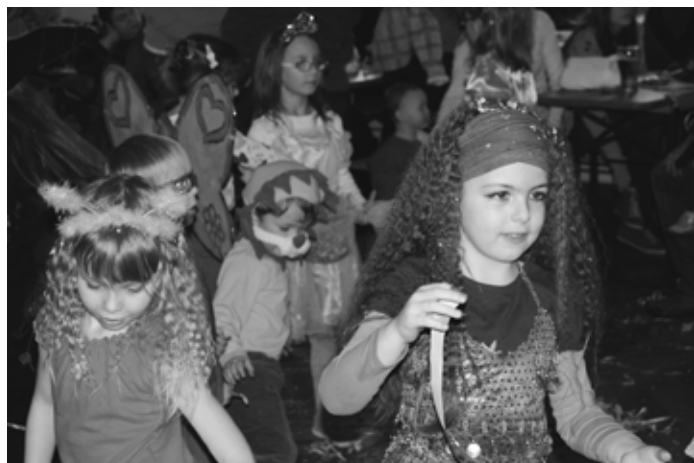
Dětský maškarní v Kadově