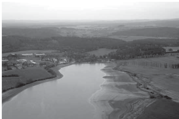
Myštice_Letecký pohled na část rybníka Labuť