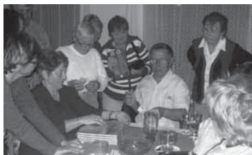
Po besedě v Myslívě podepisují knihy

„Opakovaně jsem zván a velmi rád jezdím do Kasejovic, byl jsem několikrát v Plzni, Praze, Soběslavi, Písku, Táboře, v Ostravě, ve Frýdku – Místku nebo v Olomouci. V krajských městech občas dávám rozhovory do regionálního rozhlasového vysílání. A samozřejmě také v Blatné, Sedlici, Myslívě a v dalších okolních obcích. Manželka mě vždy doprovází. Zvome mě i do škol. Měl jsem trému, že děti budou unuděné nebo nepozorné. Nakonec jsem poznal a byl jsem tomu opravdu rád, že děti jsou velmi zvědavé. Dotazy mají promyšlené, nikdy mě to neodradilo. Když mě pozvou, jezdím do škol velmi rád. Jsem patriot Jižních Čech a Blatenska. Vždy s sebou na cesty, ale i na besedy vozím letáky, pohlednice. Dávám v Čechách a světu vždy vědět kde jsem doma. Musím všem vždy ukázat Blatensko, protože jsem tu šťastný. Mám to tu rád.“