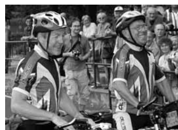
Návrat z cesty po Evropě, tak vypadá opravdová radost