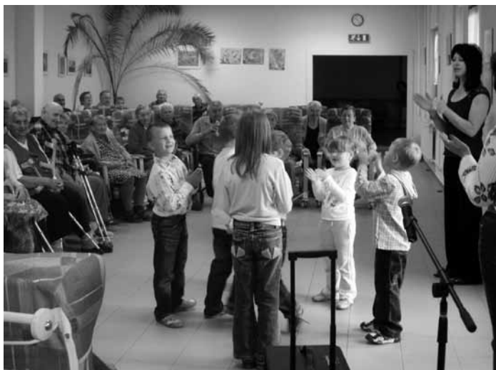
Výstoupení dětí z MŠ Vrchlického Blatná