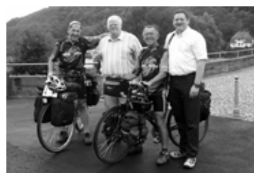
Druhá návštěva partnerského města Vacha při cestě po bývalé železné oponě