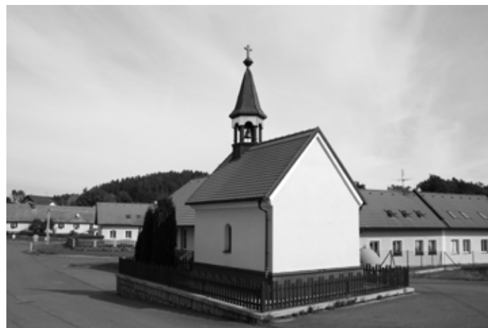
Kaplička v Metlich