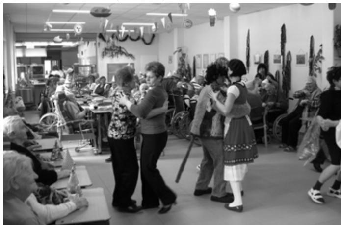
Na masopustní úterý zavítali i senioři z města Blatná