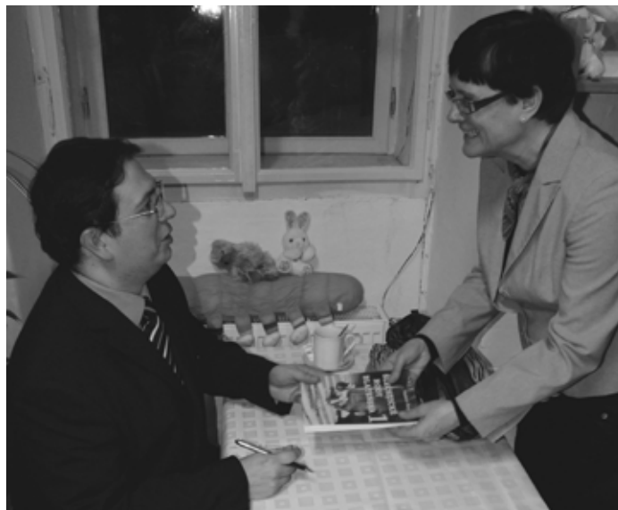
Součástí prezentace byla rovněž autogramiáda