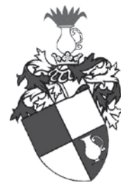
Rodový erb Bukovanských Pintů z Bukovan

„Nebo račtež toho povážiti což mohu za pravdu psáti majíce třináctero dětí, vosmero synů a dcer dorostlých a patero malých nedorostlých, a na ten čas všecky doma mám, jak jest na mně potřeba a jaký jsou nyníčky náklady a drahoty. Na ty šaty jak ve všem veliká drahoty, že dosti špatná sukně panenská třiceti čtyřiceti kop [grošů] (kopy grošů, respektive kopy grošů míšeňských – dobová početní jednotka ve finančních operacích, poznámka autora) stane, a když jeden pojednou čtyři, pět sukení zjedná, co ty musejí státi. Nebo těchto dnů vypravivši manželku svou do Prahy pro mnohý potřeby, toliko aby na čtyři sukně hedbávný a mantliky, co k tomu náleží, dcerám za hotové peníze vzala. Dal jsem jí tři sta kop na to a na jiné potřeby, ještě to postačiti nemohlo, do padesáti kop se ještě u kupce vzdlužiti musela a dost málo za to pojednala. Tolikéž synové moji dosti mi z měšce vynímají. Loňského roku, toť se svého Pána Boha v tom dokládám, žeť sem na ně, na tři syny, na koně, zbroje, ručnice a jiné mnohé potřeby do dvanácti set kop míšeňských