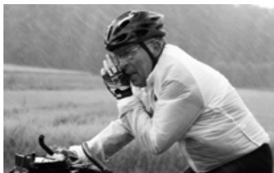
I takové počasí bylo cestou po Evropě z Prahy do Paříže sám.

část z výtěžku z prodeje knih věnuji na humanitární účely. V rámci adopce na dálku máme studentku v Indii. Nadaci KRTEK – 'Cyklisté dětem', která podporuje léčbu dětí s onkologickým onemocněním, jsme předali finanční příspěvek. 'Několikrát pan Šesták zdůraznil, abych to snad ani raději nepsal. Ba ne, napíšu. Třeba jako inspiraci pro další dárce. A jak vypadá příprava na cestu?