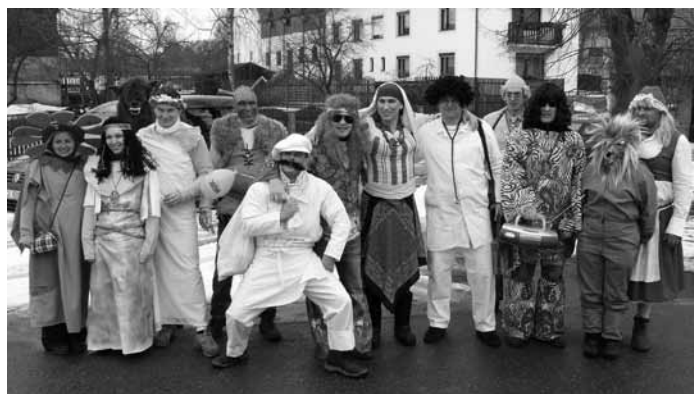
Dobrá parta a dobrá nálada - to je masopust v Leskovicích