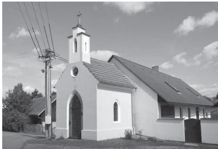
Uzeničky