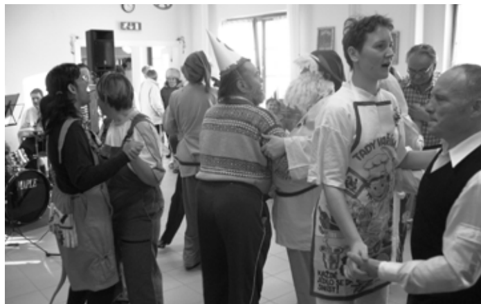
Masopust, k tanci a poslechu hrála Osečanka