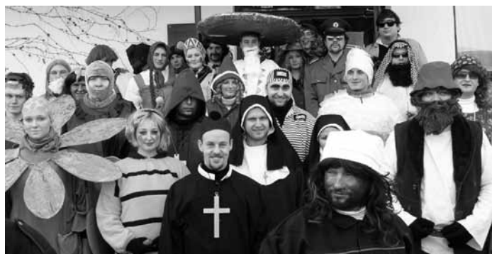
Masopustu v Radomyšli, který prošel velkou generační obměnou, se zúčastnil rekordní počet masek