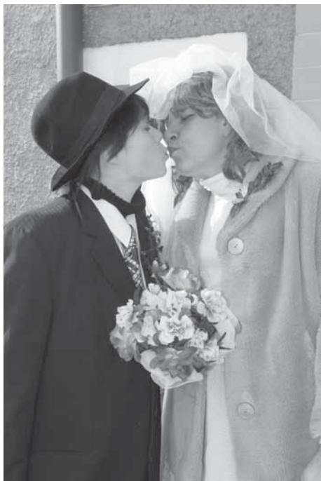
Masopustní sličná Ženicha a pan Nevěsta

Letos se sešlo 26 maskovaných nadšenců a až do pozdního odpoledne obcházeli ves za doprovodu dvou statečných harmonikářů. Občané mohli obdivovat roztodivné maskary, bytosti hororové (gangstery, mumii a zabijáky), pohádkové (vílu Amálku, čarodějnici, čerta, rytíře, klauna), pracující lid (zahradníci, zlatokopky, stavitele),