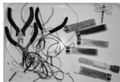
Uzka potřeb na výrobu drátkovaných ozdob

neuvadnou. Jsou vyrobené z miniaturních korálků. Hned na to si uvědomuji, že na okně v květináči jsou zvláštní orchideje. „Když odkvetly a ne a ne začít kvést opakovaně, vyrobila mi dcera její květy také z korálků.“ Je vidět, že nadání na ruční práce mají v rodině.