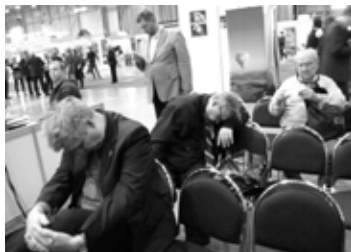
Zmožení návštěvníci v Brně, foto Dominika Květoňová