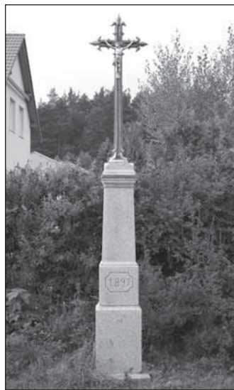
Kříž ku Kocelovicům