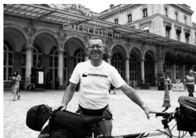
Paříž, cíl sólové cesty z Prahy

Cíle si vybíráme podle svých představ. To je štěstí, že si může člověk plnit své sny. Máme cíl, motivaci, náplň, není to jen 'polykání' kilometrů. Cesty si vždy financuji sám, snažím se, aby to nebylo na úkor rodiny a