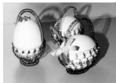
Košičky na kraslice

„Moje mladší dcera. Byla na nějakém kurzu, kde se drátkování naučila. Když jsem k ní přijela na návštěvu, pobízela mě, abych si to zkusila. Nejdříve jsem nechtěla. Říkala jsem si, na to mě holka nenachytáš.“