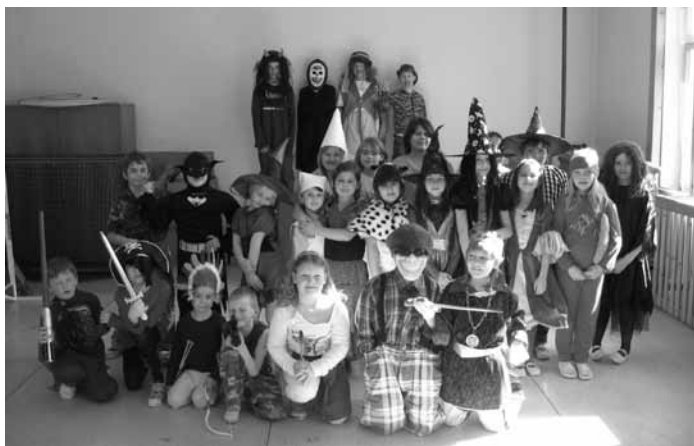
Všechny školní maškary

dost. Sladké dobrůtky pro šikovné kluky a holky byly určitě velkým lákadlem.