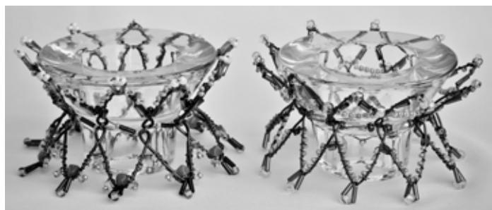
Stojánky na čajové svíčky

„Mám ráda prakticky všechny ruční práce. Už když mi bylo dvanáct, upletla jsem svému bratrovi první svetr. S norskými vzory. A tady, ta kytička, tu jsem dostala od své druhé dcery.“ Na poličce ve váze je kytička konvalinek. Sice nevoní, ale taky nikdy