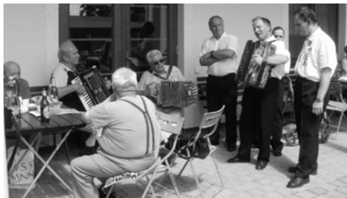
Blatenská rolnička, setkání seniorů z různých sociálních zařízení. Výstoupení harmonikářů