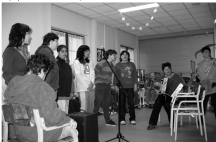
Mikulášská nadílka, zpívala děvčata z Mačkova