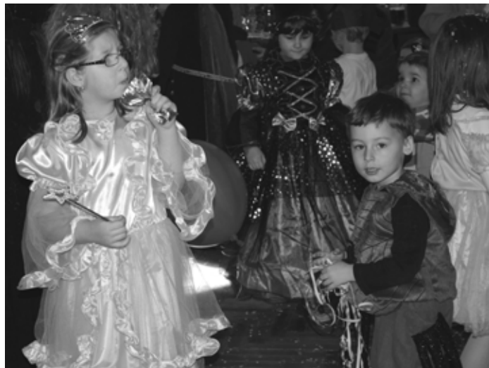
Dětský maškarní v Kadově