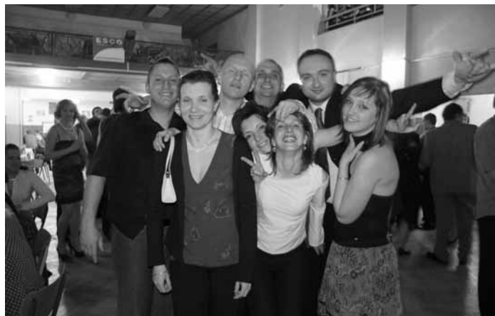
Na hasičském plese se lidé dobře bavili

hasičským znakem a nápisem Hasiči Radomyšl. Ale co s ním? Při pohledu na tu krásu ho všichni chtěli.