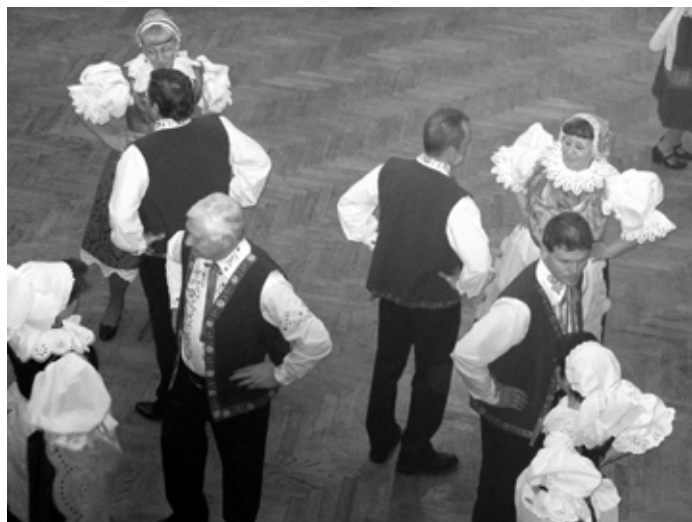
Baráčníci na pivovarském plese

Česká a Moravská beseda má v Radomyšli dlouholetou tradici z dob tetičky Habadové a málo kdo z pamětníků a rodáků může říct, že se s tímto tancem nesetkal. V Radomyšli jsme na tuto skutečnost pyšní a chceme v tradici nadále pokračovat, aby se z této krajiny nevytratily její stopy.