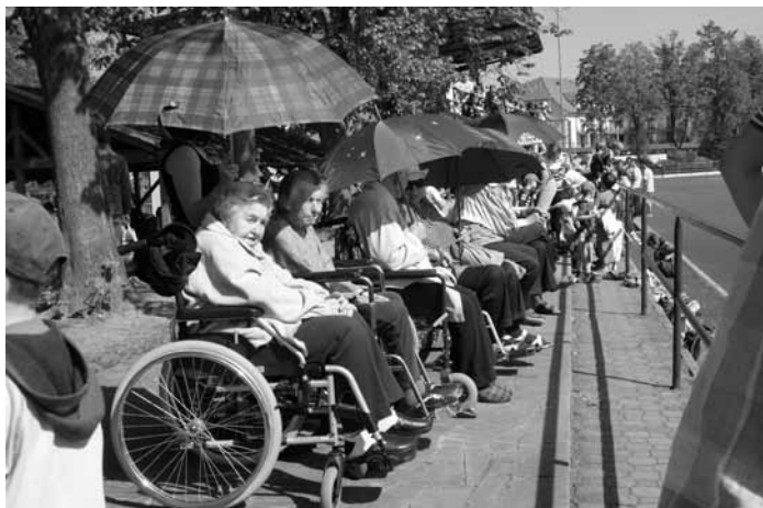
Májový běh 2011, naši klienti fandí