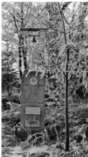
Zvonička v křišťálu jinovatky v Březí

Až do roku 1848, kdy byla robota zrušena, jezdili sedláci ze Březí robotovat na hospodářství rožmitálského panství do Roželova. Při ranní cestě za prací, jak jeli po kamenité cestě, kola rachotila, těžké povozy hrčely a v Roželově usedlíci vstávali a říkali: „Hrčáni jedou.“ Toto zůstalo jako přezdívka od celého okolí dodnes. Občané ze Březí to však nepovažují za přezdívku a k tomuto pojmenování se hlásí, neb naši dávní předkové tímto dávali najevo, i když museli robotovat, svoji pracovitost, která dodnes ve Březí platí. I za soukromého hospodaření až do roku 1956 (2. 3. 1956 bylo založeno JZD) pracně a s veškerou pílí obdělávali těžko obdělávatelná políčka v pahorkatém terénu katastru obce