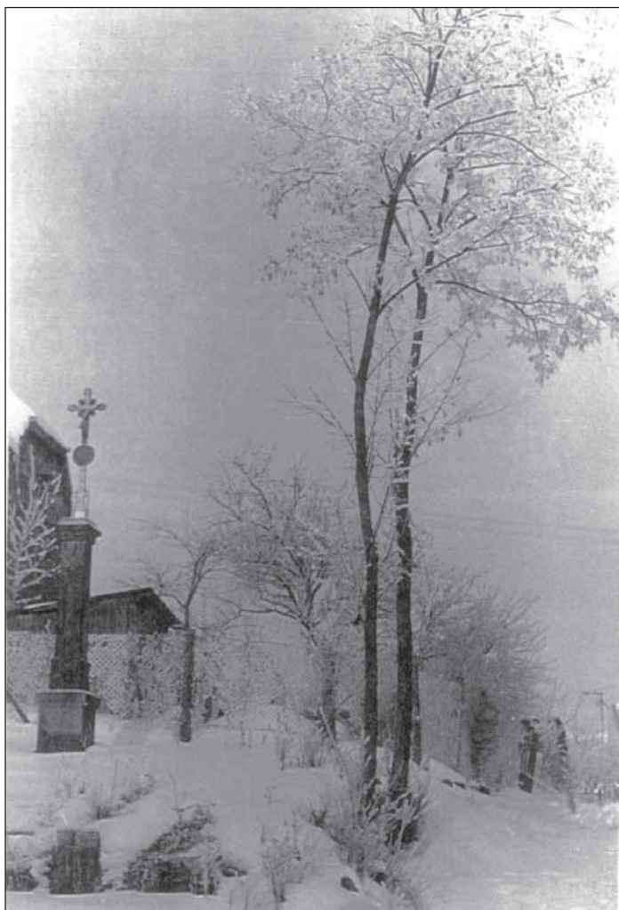
Křížek u Kutáků, r. 1965