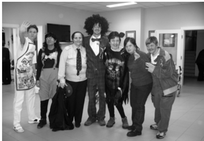
Masopustní úterý za účasti klientek Domova Petra Mačkov