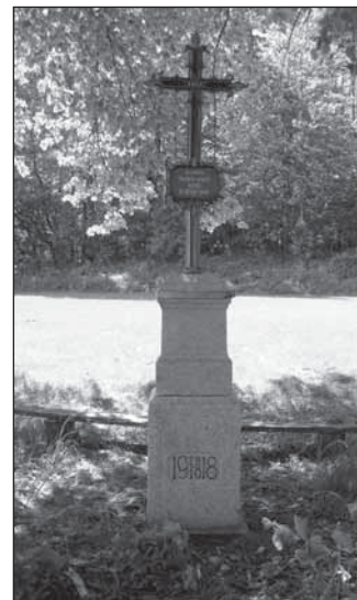
Kříž Na Pastouškách