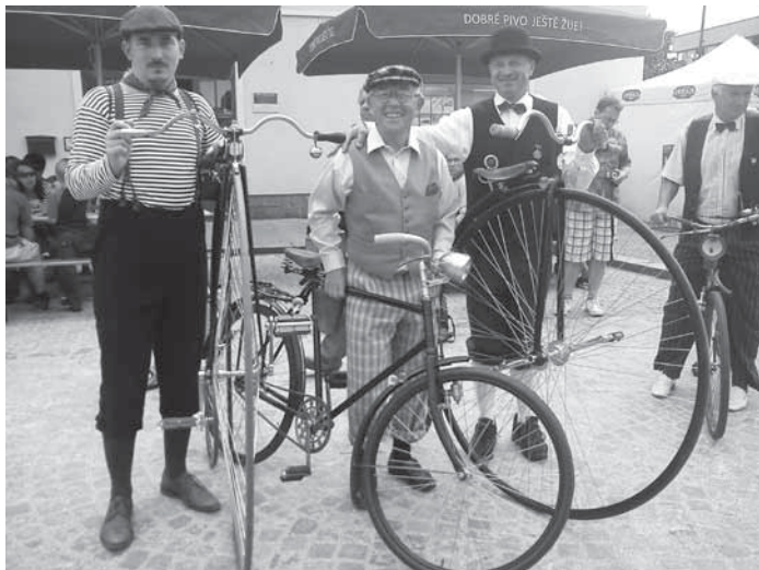
Rybářské slavnosti v Blatné 2011, kolo zn. Premiér jsem dostal k sedmdesátce

První závody na kole, vzpomenete si, které to byly?