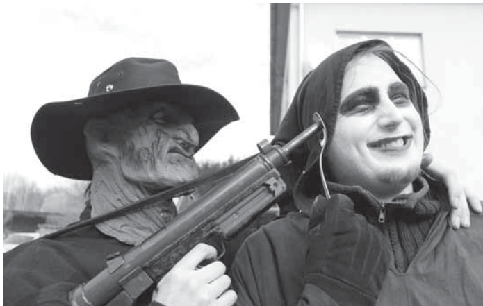
Masopustní hororové masky

V oblastech, kde dosud řádně udržují lidové zvyky, oplakávají konec Masopustu opravdu na poslední chvíli - až v úterý před Popeleční středou. Jako by si chtěli užít radovánek až do poslední vteřiny. U nás jsme se již přizpůsobili možnostem běžného týdne a rej masek vyrazil do ulic v sobotu.