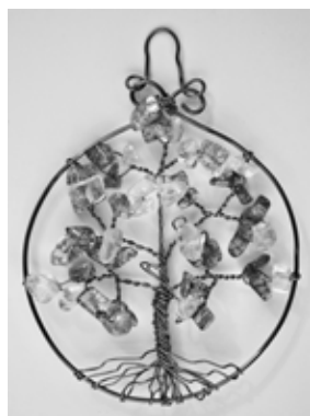
Závěsná ozdoba se stromkem

„Teď už chodí nápady samo sebou. V noci třeba ležím, už usínám. Najednou mám nápad na vzor nebo na osobičku. Musím vstát a hned si to nakreslit nebo ještě lépe hned si to vyzkouším a udělám. To víte, při mé 'cementárně' bych na ten nápad mohla do rána zapomenout.“ A všechny jsme se srdečně zasmály.