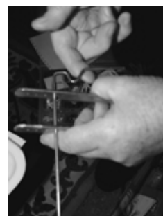
Šmedrlink na výrobu pružinek

„začínala jsem s drátkováním kolem skleniček. To je snadnější. Na zvoneček mám 'kopyto' a jinak to dělám takhle v ruce. Vidíte?“ A přináší další krabičky, a ještě vajíčka. Vždyť se blíží Velikonoce. „A tady mám připravené kraslice. Různě silné a různě barevné drátky, mašlička, některé kraslice jsou ozdobené malinkatými korálky, některá kraslice je třeba obarvená v cibulových slupkách. Pak vynikne stříbrný drátek a žluté nebo bílé korálky. Na tu pružinku mám takové 'udělátko', podívejte. Říkám tomu šmedrlink.“ Než