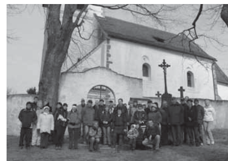
Účastníci vlastivědné vycházky před kostelem Všeoh svatých v Řesanicích

První z nich s názvem JĚ NA ZÁPAD CESTA DLOUHÁ se uskutečnila v neděli 4. 3. 2012. Na kasejovickém náměstí se nás sešlo