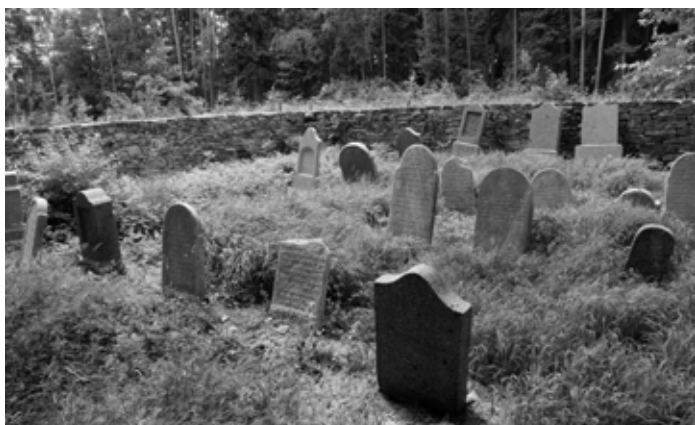
Židovský hřbitov