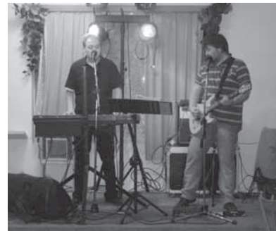
Zvuková zkouška skupiny Talisman-ST

Jako již každoročně se poslední sobotu v únoru konal Obecní ples. Pořadatelem je zastupitelstvo obce tj. Obec Velká Turná. Sál Hospody Na Rozhrání byl dne 25. února 2012 připraven na pravou vesnickou zábavu. K tanci a poslechu zahrála místní skupina Talisman-ST. Začátek byl ve 20:00 hodin. A konec byl naplánován až do padnutí posledního tanečníka. Tento stav nastal ve 4:00 hodiny ráno. Kapacita sálu byla zcela naplněna a zábava nabrala brzy na obrátkách. Obecní ples ve Velké Turné je zcela sousedskou záležitostí, protože přítomní hosté jsou všichni z obce. Díky tomu je i atmosféra večera přátelská a plná zábavy. Již nyní se těšíme na další setkání.