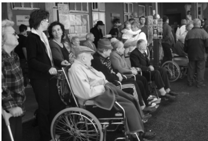
100 let železnice v Blatné